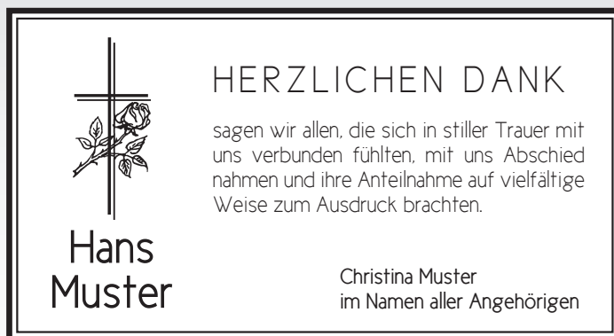
D23 Schrift: New Cicle Bild: Kreuz Rose | 300349