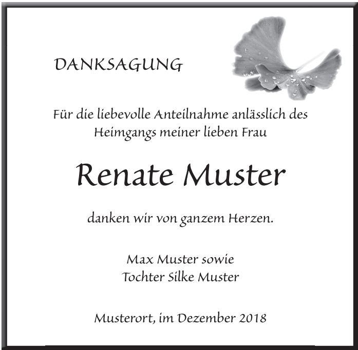
D20 Schrift: Sanvito Bild: Ginkgo_02_sw