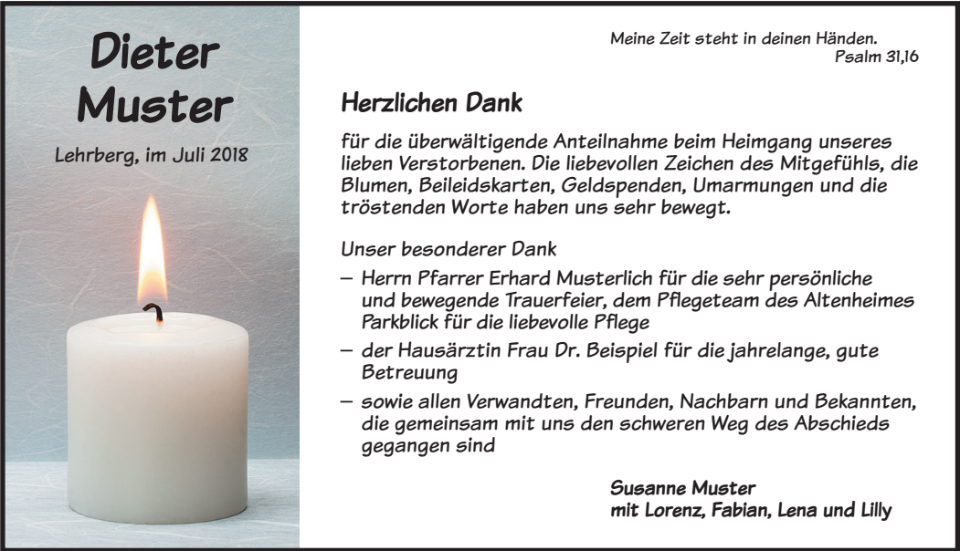
D12 Schrift: Komika text Bild: Kerze_streifen_4c 43694_A