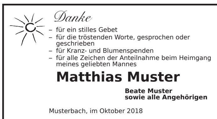
D25 Schrift: Bitstream Vera Sans Bild: Sonne_10