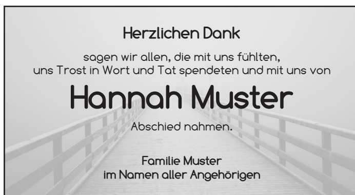
D24 Schrift: Comfortaa Bild: Steg