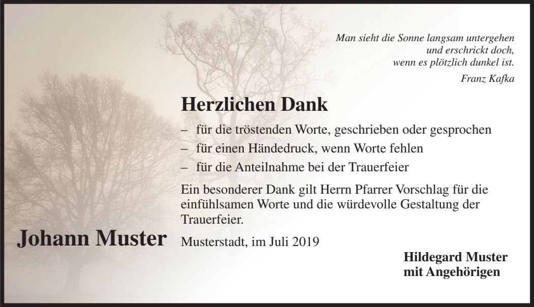
D11 Schrift: Times Bild: Bäume im Nebel 3sp80 43693_A